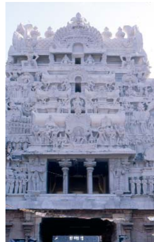
Erzählungen der Legenden an den Außenmauern in Shrirangam in Tamil Nadu, Südinien.

Zurückgekehrt in den Himalaja, führte Bharadvaja alle Weisen in die Ayurveda ein, die dieses Wissen sofort in die Tat umsetzten und alle ein langes, gesundes Leben führten. Punarnava Atreya hielt aus Mitgefühl für alle Lebewesen seine sechs Schüler an, dieses Wissen vom Leben niederzuschreiben.