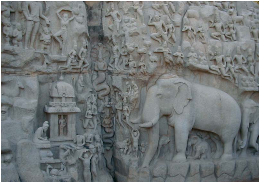
Die Geschichte Indiens in Stein gemeißelt: Das eindrucksvolle Basrelief von Mahabalipuram aus dem 7. Jahrhundert: »Die Herabkunft des Ganges«.

Obwohl die Buddhisten die vedischen Schriften nicht akzeptierten, übernahmen sie die ayurvedische Medizin. Dies belegt, dass Ayurveda schon zu jener Zeit mit keinem unumstößlichen Dogma verbunden war.